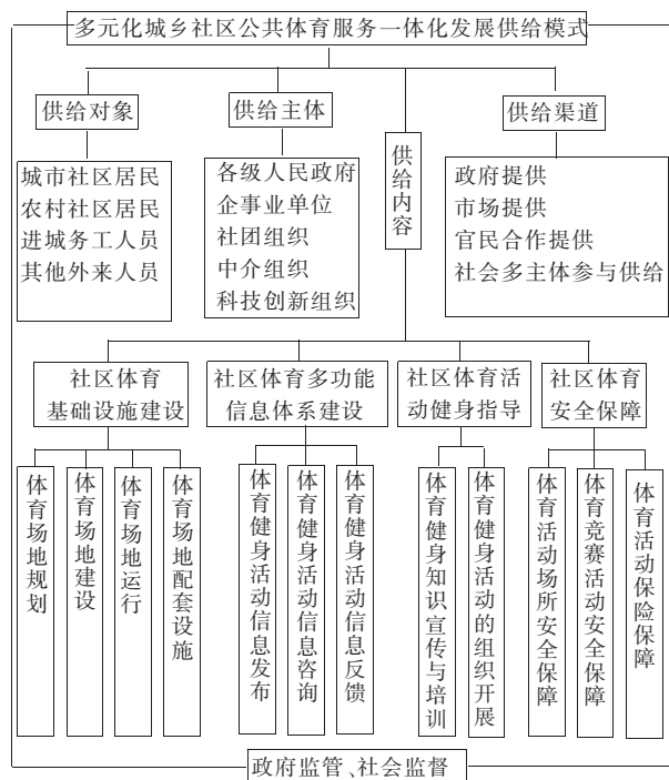
图1 多元化城乡社区公共体育服务一体化发展供给模式的基本框架